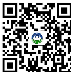
辽宁政务网网上申报流程图

http://sxzspzx.tieling.gov.cn/tlzwdt/epointzwmhwz/pages/eventdetail/personaleventdetail?taskguid=21231133-9e79-4230-928d-b63ff89d0410