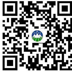
辽宁政务网网上申报流程图